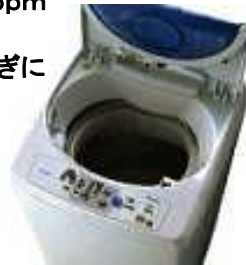
洗濯機に最後のすすぎに 入れて、消臭・除菌