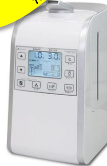
アキュテクト専用噴霧器HM201

超音波噴霧器はアキュテクトの効果を最大限に発揮。1秒間に200万回以上振動するチタン製の振動子を内蔵しており、次亜塩素酸水を3ミクロン前後の非常に細かい微粒子にして、室内空間に噴霧します。人体に影響なく生活空間の浮遊菌を除菌することが可能になりました。（なお噴霧器は耐塩素コーティングした専用噴霧器を必ずご使用下さい。）