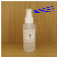
希釈済み 100ml小スプレー