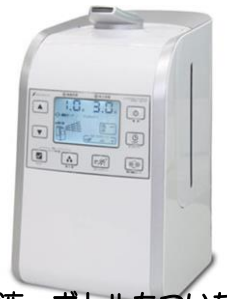
原液・ボトルもついたセットで税別46000円