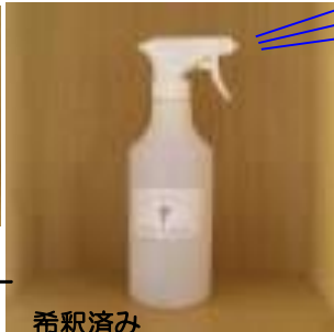
希釈済み 500ml大スプレー