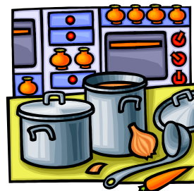
厨房施設 調理器具・手の除菌 生ゴミの消臭 食中毒対策に

また皮膚と同じ弱酸性で皮膚を荒らしません。 排水に流してもすぐ水になるため環境にも優しい水です。