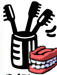
歯ブラシ・ 入れ歯の除菌