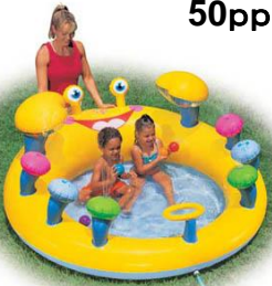
プール熱(咽頭結膜熱)はアデノウイルスによって 発症します。アデノウイルスは0.5ppm以上で死滅します