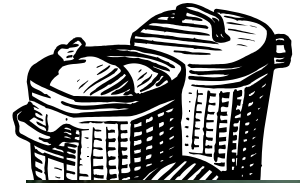
生ゴミの除菌・消臭 80~100ppm